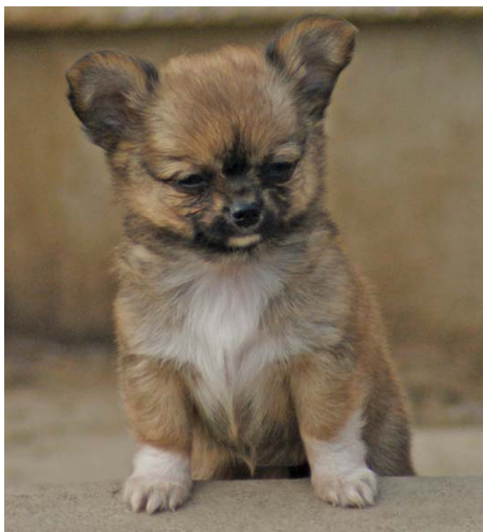
Beatrice Ouertani Rindlisbacher, Yuma of Beminita

Le plus petit des chiens se croit très grand parfois: les Chihuahuas ne sont pas de petites choses fragiles, mais de courageux gardiens de petite taille.