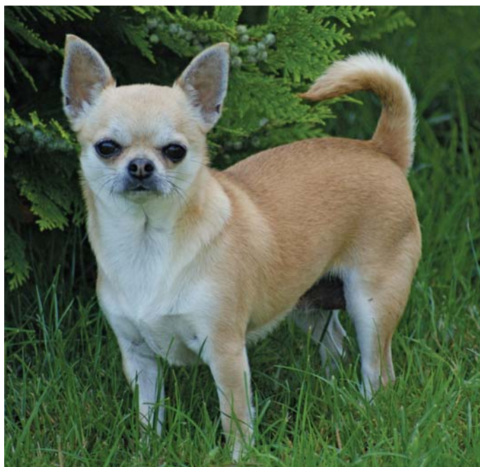
Beatrice Ouertani Rindlisbacher