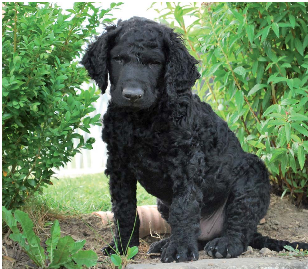
Atlas Beautiful Curl of Schwarzseeland (6 semaines).

en plus répandus. En dépit de sa baisse de popularité, aujourd'hui, le Curly Coated a retrouvé sa place parmi les Retrievers. On en trouve actuellement avant tout en Angleterre, en Australie, aux Etats-Unis et en Scandinavie. Nous trouvons aussi quelques passionnés qui élèvent cette race en Suisse.