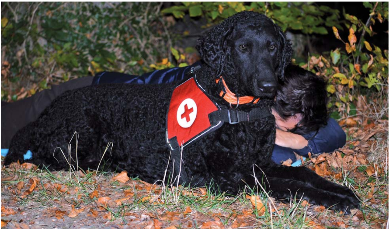
Daiji au travail (quête sanitaire).

sûr de lui, ceci joue un grand rôle dans l'éducation et la formation du Curly. Il a beaucoup de plaisir à jouer avec son maître.