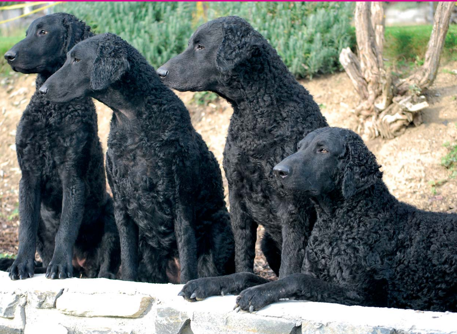
Ganja, Opal, Sky, Daiji