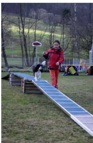
Planche sur tonneau: le chien passe sur la planche et s'arrête au milieu 5 secondes.

Passerelle: le chien passe la passerelle en marquant un arrêt bref au milieu.